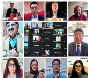
参加国际性学术论坛